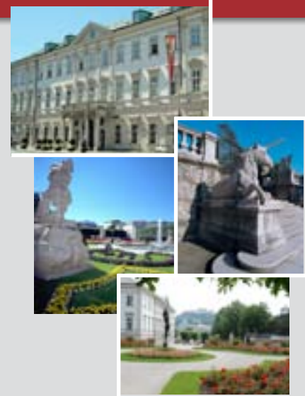
Schloss Mirabell und Mirabellgarten

Vienna, gave Mirabell Palace its sober modern-day appearance. Details like window frames, column crowns and stucco work all hark back to an earlier age of magnificence. One of the most splendid features of Mirabell Palace is its staircase with marble steps crafted by Lukas von Hildebrandt. The dainty putti, highly decorative marble balustrade and the sculptures in the niches are masterpieces produced by the master himself, Georg Raphael Donner, and are some of the most beautiful works of the European baroque era. The palace chapel features a ceiling painted by Bartolomeo Altomonte dedicated to Saint Nepomuk. 1866: Imperial gift of the palace to the city. Nowadays Mirabell Palace houses the offices of the Mayor of Salzburg and the city's administrative body. The marble hall is the former festival and banqueting chamber of the prince archbishops in which Leopold Mozart and his children, Wolfgang and Nannerl, often played, and today it is considered to be one of the 'most beautiful wedding venues in the world'. The venue regularly hosts conferences, award ceremonies and atmospheric concerts (Salzburg palace concerts).