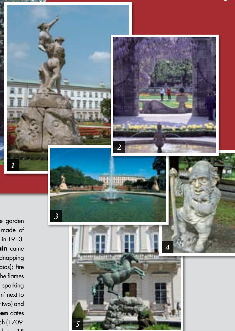
1 „Der Raub der Persephone“, eine der vier Figurengruppen rund um den Springbrunnen 2 Papagenabrunnen 3 Springbrunnen 4 Zwergerl im Zwerggarten 5 Pegasusbrunnen